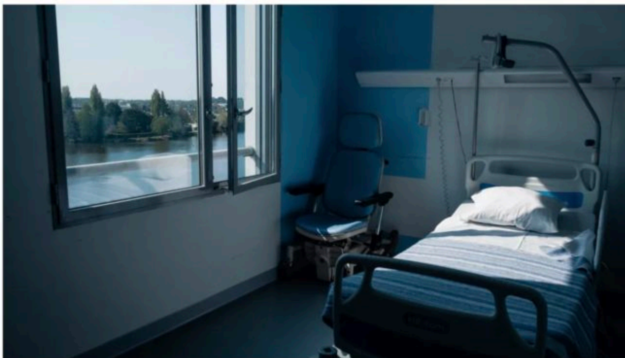
Un lit d'hôpital vide au Centre hospitalier Bretagne-Atlantique, à Vannes (Morbihan), le 21 avril 2021.