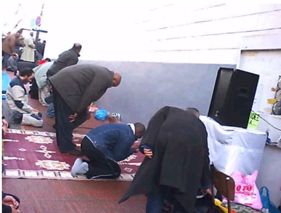
Le deuxième haut-parleur.

http://www.youtube.com/watch?v=0jl7FxF9aRA