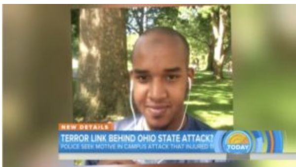
Did Ohio State University attacker have terror ties? 2:26