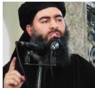
CALIFFO Abu Bakr Al Baghdadi, leader dell'Isis

Senza alcuna vera infrazione, il poliziotto che era forse già in vista alle sue gerarchie poiché simpatizzante del Front national, è stato condannato a 5.000 euro di penalità dal tribunale di Parigi e, non avendo di che pagare, ha fatto appello ad altre corti di giu-