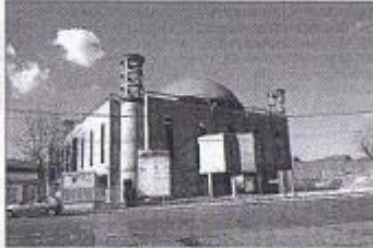
Depuis décembre dernier, le chantier est arrêté