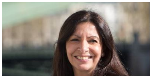
Anne Hidalgo on Twitter

Naturellement, les bobos français islamo-collabos montent de suite au créneau, et nous refont le coup des fleurs, des larmes et des bougies. En tête, bien évidemment, l'ineffable Hidalgo.