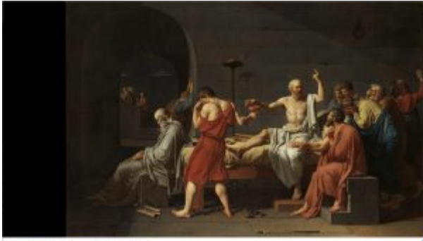
Alibi de Socrate, par Jacques-Louis David (1787)

Puisque nous sommes dans les réminiscences littéraires, c'est Socrate qui, condamné à mort pour des raisons politiques, ce n'était pas un truand, refuse de s'évader comme il en a la possibilité, parce que toute sa vie il a prôné l'obéissance aux lois, même celles avec lesquelles on n'est pas d'accord - les Insoumis devraient en prendre de la graine, mais ces incultes ne connaissent même pas Socrate. Mais, surtout, Platon raconte cette scène extraordinaire de Socrate qui passe ses dernières heures en prison en compagnie de quelques amis autorisés et qui continue, jusqu'au bout, à discuter, à commenter, à pratiquer la maïeutique... qui boit la cigüe et commente la mort qui monte, sereinement, ses jambes qui s'appesantissent. Et part sereinement, se contentant de rappeler à l'un des amis présents qu'ils doivent le sacrifice d'un coq à Esculape.