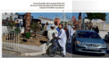
Lumel aux mains de l'État islamique