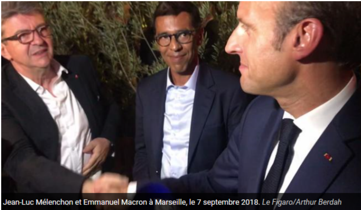
Jean-Luc Mélenchon et Emmanuel Macron à Marseille, le 7 septembre 2018.

Jean-Luc Mélenchon, le faux rebelle, face à Emmanuel Macron, le président des imposteurs, dans une rue de Marseille, ça vaut son pesant de cacahuètes, même quand depuis longtemps on sait exactement à quoi s'en tenir sur la réalité du pitoyable pitre qu'est le premier, se prenant pour un grand homme, de même que sur les perpétuelles déclarations mensongères du second.