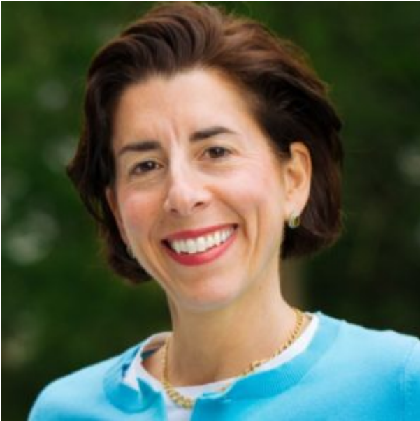
Commerce : Gina Raimondo