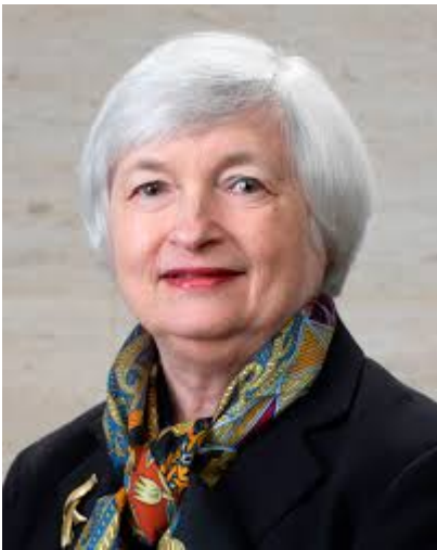
Finances : Janet Yellen