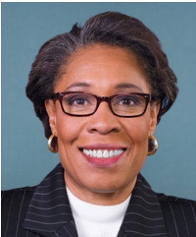
Logement, développement urbain : Marcia Fudge