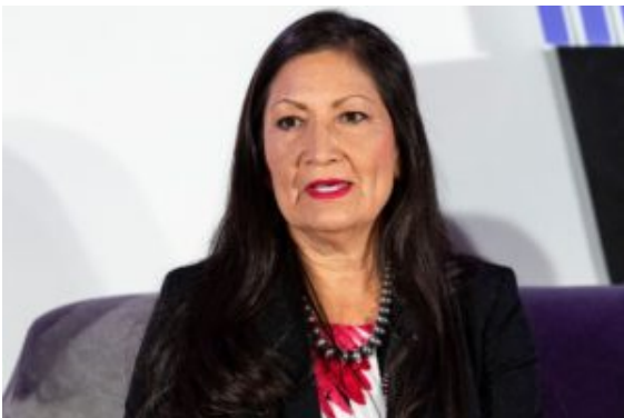
Intérieur : Deb Haaland