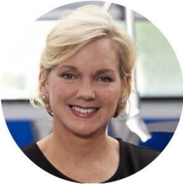
Énergie : Jennifer Granholm