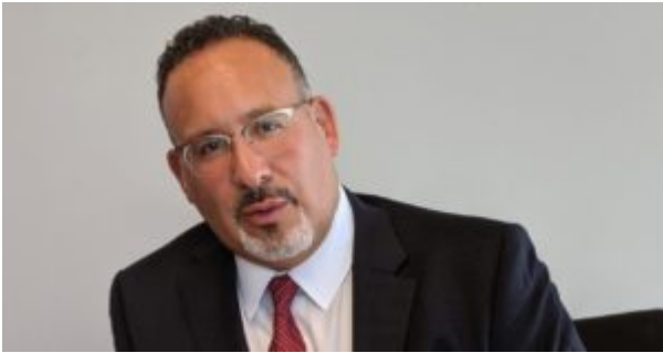
Éducation : Miguel Cardona , 45 ans