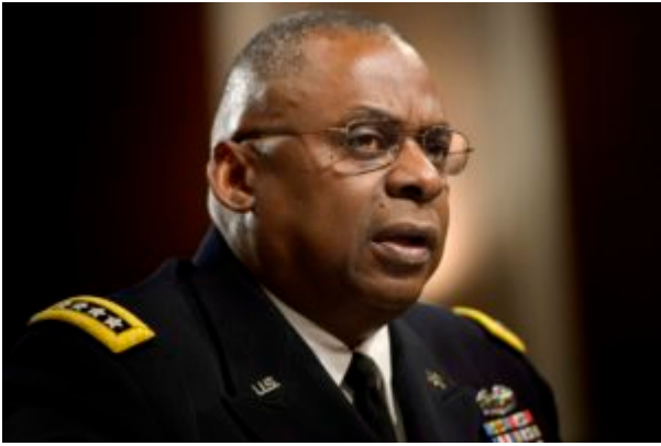
Défense : Lloyd Austin , 67 ans