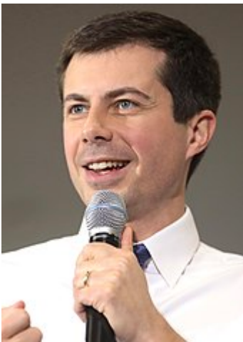
Transports : Pete Buttigieg , 39 ans