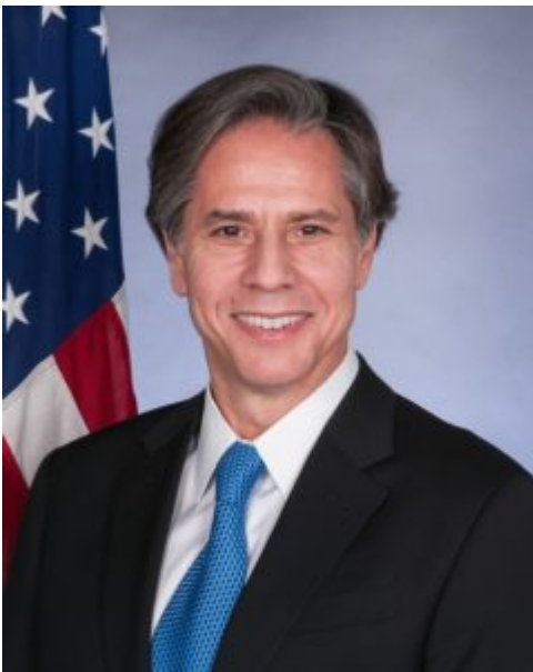
Affaires étrangères : Antony Blinken , 58 ans

Voici néanmoins ses quinze membres, pour mémoire. On remarquera, sans vouloir faire preuve de mauvais esprit, que le mâle blanc de plus de 50 ans y jouit d'une certaine surreprésentation :