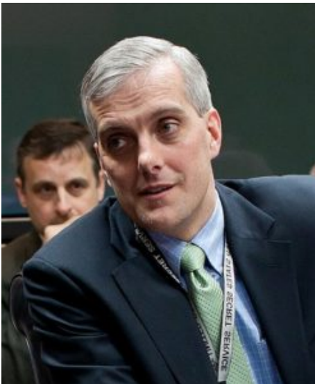
Anciens combattants : Denis McDonough , 51 ans