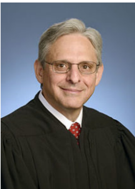
Justice : Merrick Garland , 68 ans