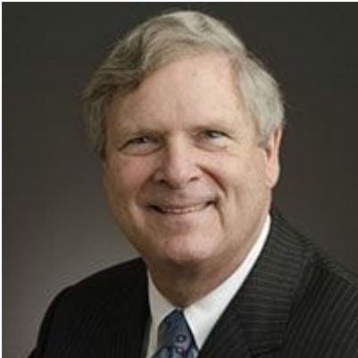
Agriculture : Tom Vilsack , 70 ans