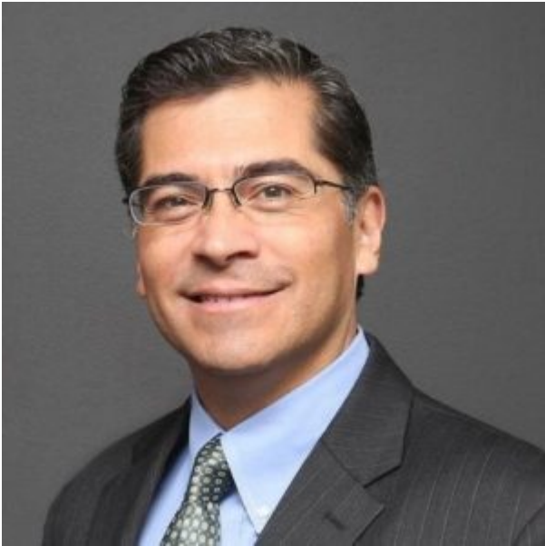
Santé, services sociaux : Xavier Becerra , 62 ans