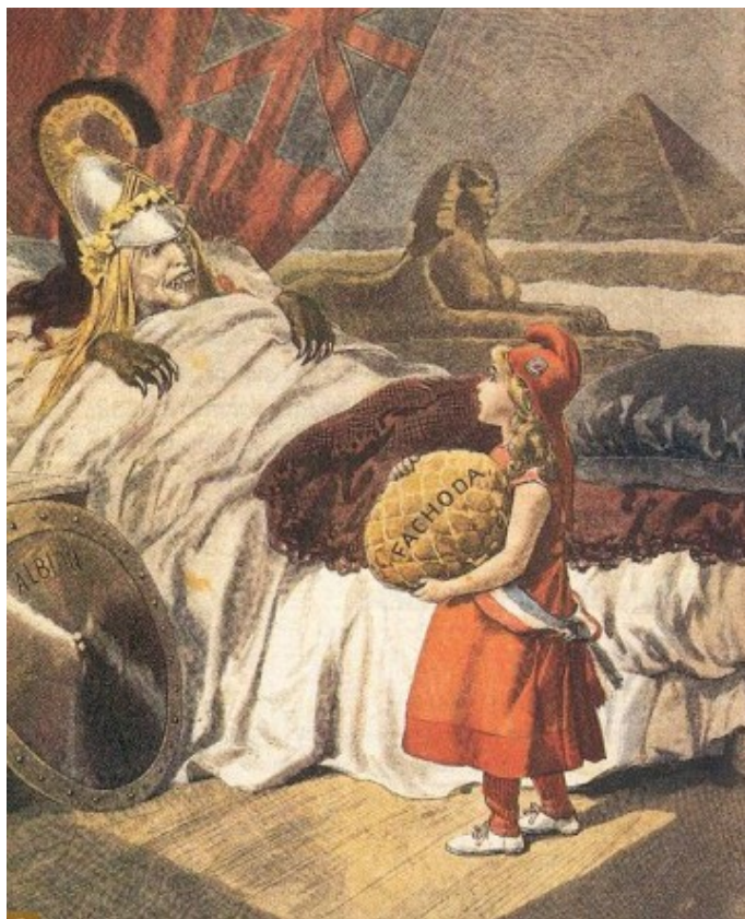
La perfide Albion

Les jours prochains vont être l'occasion à la France dite Républicaine, ainsi qu'à ces pauvres lobotomisés français de rendre hommage à leurs ennemis héréditaires.