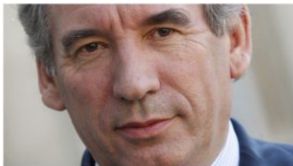
François Bayrou

François Bayrou se délecte d'être au centre du jeu pour la primaire à droite. Et il compte bien devenir l'homme le plus influent de France si Alain Juppé est élu président.