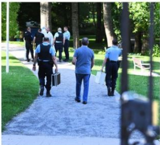
Le crime s'est déroulé en plein après-midi au cœur de la cité normande.