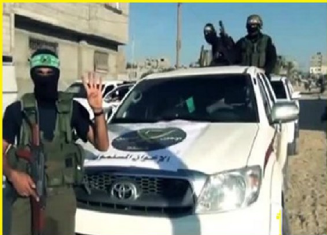
La main du Tamkine des Brigades Al-Qassam (Hamas - Gaza)