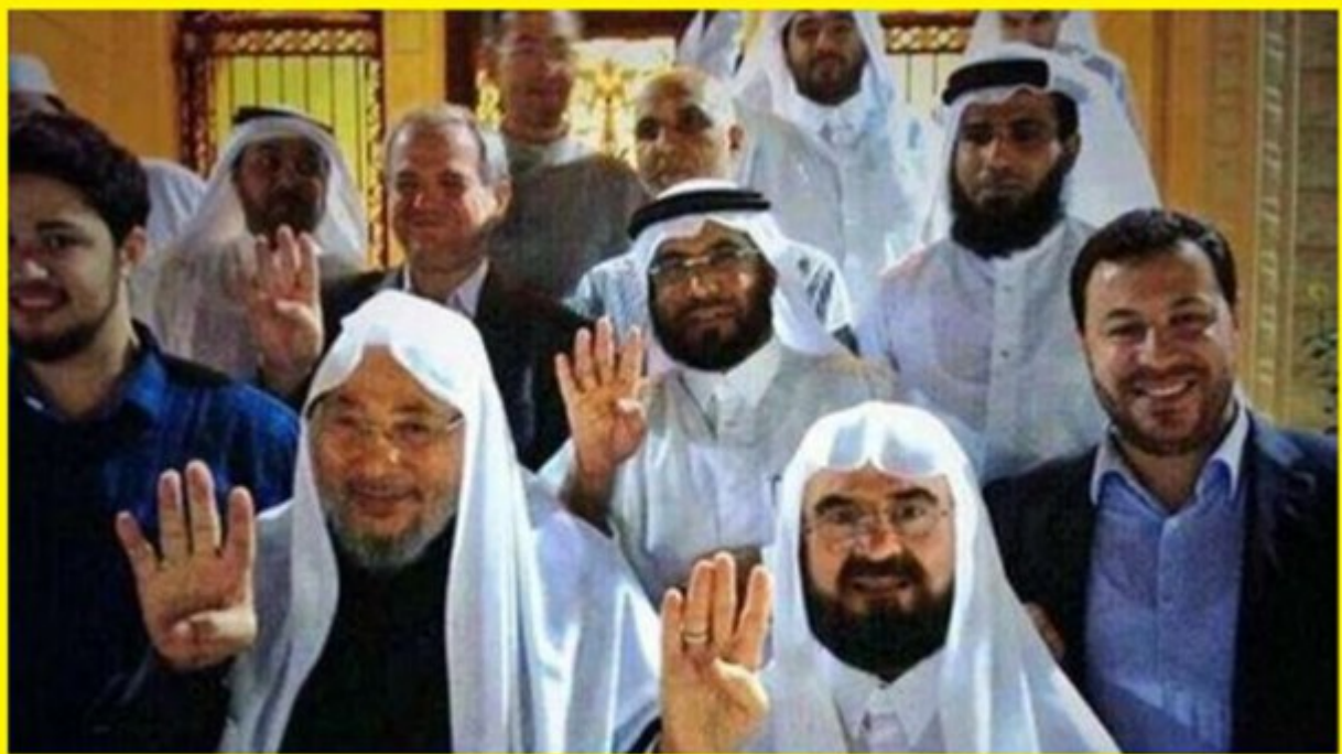
Les mains du Tamkine d' Al Qaradawi et des Membres de l'Union Islamique des Savants Musulmans