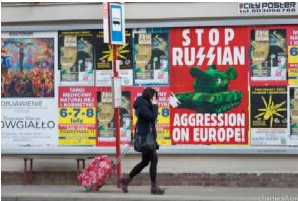
Varsovie 2015 • Les petits chars verts