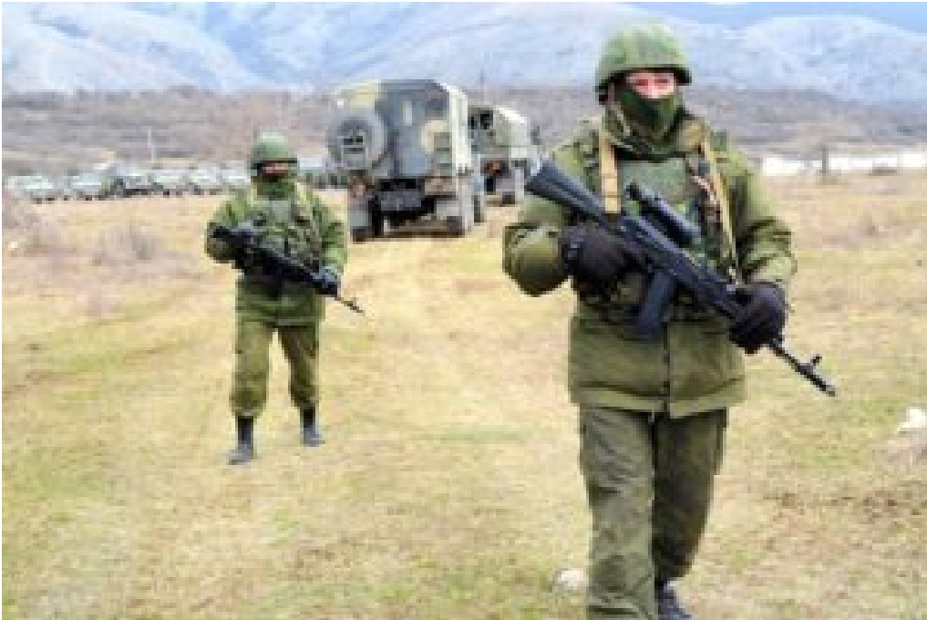
Crimée 2014 • Les petits hommes verts