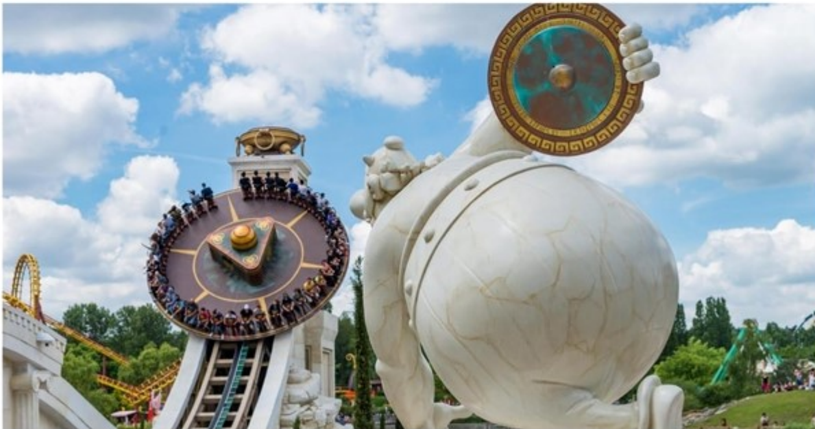
Le 19 mai, c'est validé. Les parcs d'attractions tels que Disneyland ou le parc Astérix pourront rouvrir leurs portes en France.

Le 19 mai, c'est validé. Les parcs d'attractions tels que Disneyland ou le parc Astérix pourront rouvrir leurs portes en France. Mais il faudra encore attendre quelques jours pour pouvoir profiter des manèges. « Les parcs à thème pourront rouvrir le 19 mai mais les attractions resteront fermées dans un premier temps », a