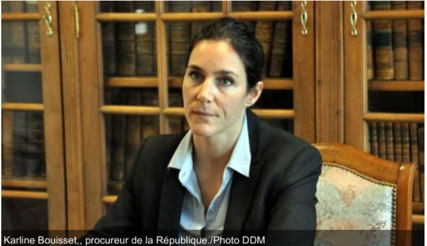
Karline Bouisset, procureur de la République.

Mais au fait, qui est ce procureur de la République qui nous fait un chantage peu élégant : balancer le nom de nos commentateurs, ou bien être sanctionné d'une lourde amende ?