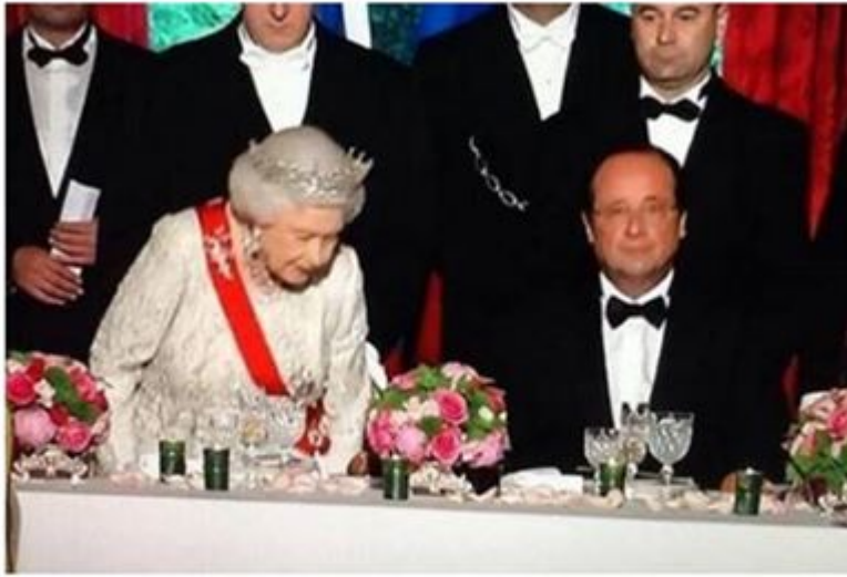
Cette photo, d'une rare muflerie, a fait le tour du monde et la honte de notre pays. Elle est dédiée aux 18 millions d'électeurs qui ont élu le plus exécrable président de l'histoire de France.