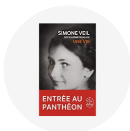
Correspondances et mémoires