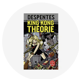
Livres de référence