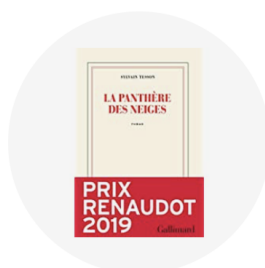
Récits de voyages