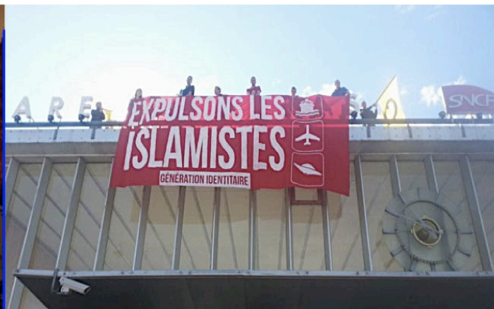
Identitaires à Arras réclamant l'expulsion d'islamistes susceptibles de commettre des attentats : banderole déployée sur un toit et attitude pacifiste

Réponse de l'Etat => dialogue, laxisme, pas de garde à vue