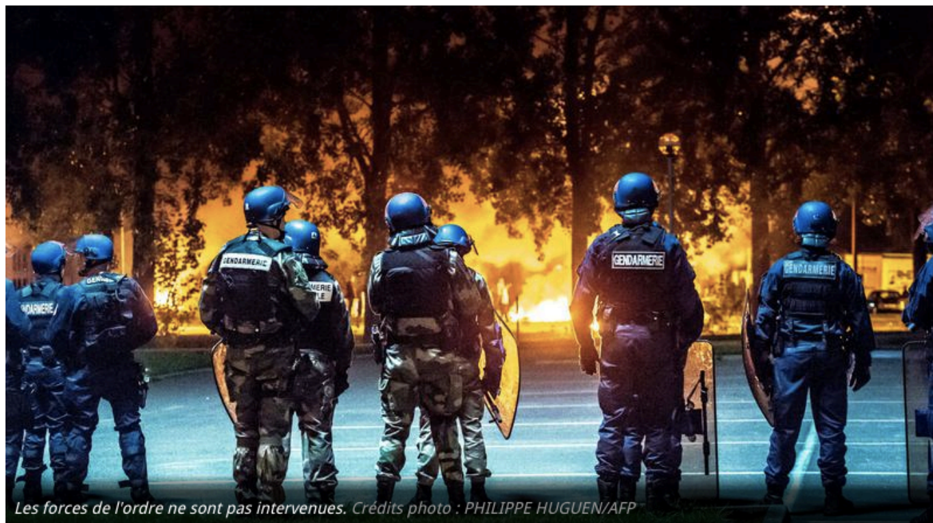
Les forces de l'ordre ne sont pas intervenues.

Une fois ces saccages effectués dans une apnée préfectorale perceptible, les plaintes peuvent tomber. En France, on n'empêche pas les nuisances délinquantes, on les estime après coup. Le pompon étant tout de même que la préfète, après avoir mouillé sa culotte de peur, se permette de pérorer que « les gens du voyage ne sont pas libres de faire n'importe quoi, n'importe où », car c'est bien ce qu'ils ont fait, et avec sa bénédiction.