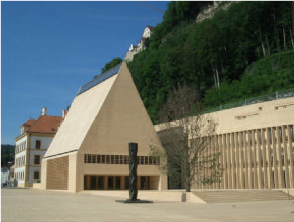
Vaduz : Parlement du Liechtenstein