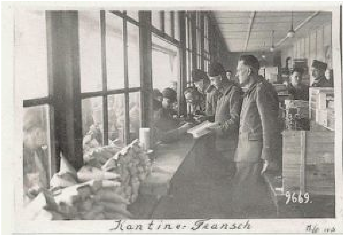
Caf t ria du camp :