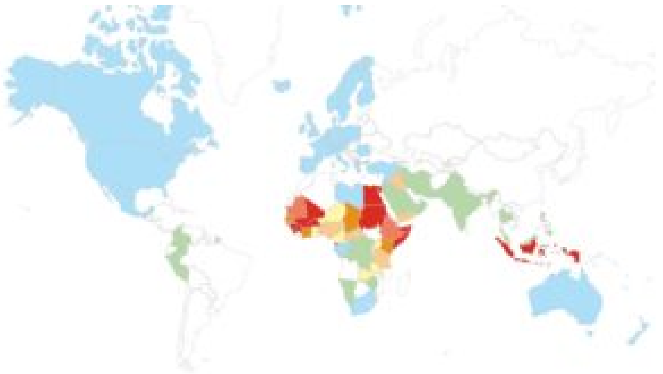
Proportion de femmes qui ont subi une mutilation sexuelle (MSF)