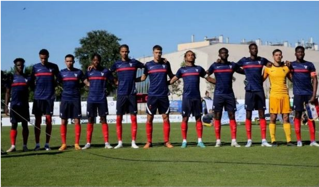
L'équipe de France U20 au Tournoi Maurice-Revello à Toulon