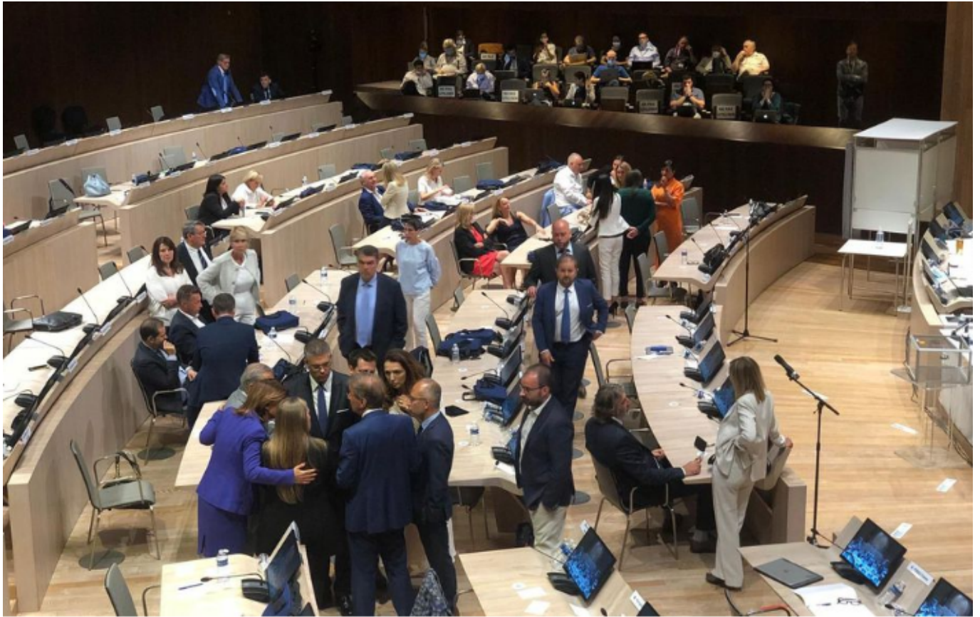
Interruptions de séance à répétition

Élire un maire à Marseille... pire qu'une sardine bouchant le port !