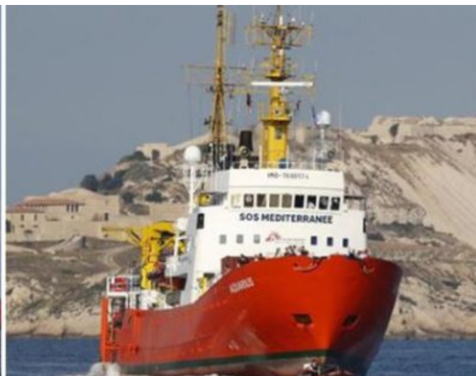
ONG Non française !