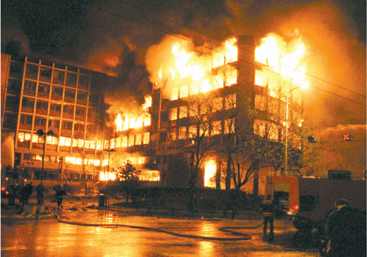
La Serbie bombardé par l'OTAN

Suite aux tensions qui règnent actuellement aux frontières de la Russie, aux discours de l'Union européenne, aux pressions des USA et aux folies malheureuses de l'OTAN comme sur la Yougoslavie, je me dis que rien ne change dans ce monde de désolation.