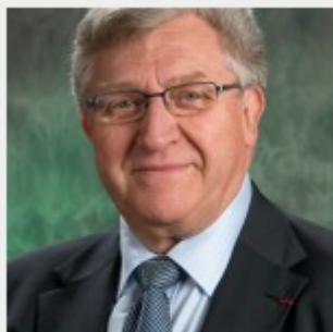
— Général Pierre Coursier