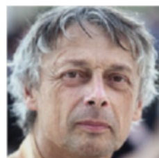
Pierre Cassen Fondateur de Riposte Laïque