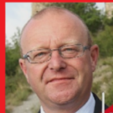
JeanLucAddor Député UDC de Sion