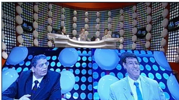
Al-Jazeera Sports - En tout esprit sportif

Voici le verbatim du débat télévisé qui a eu lieu sur al-Jazeera Sports le vendredi 13 avril. 2011 à 18h30 GMT.