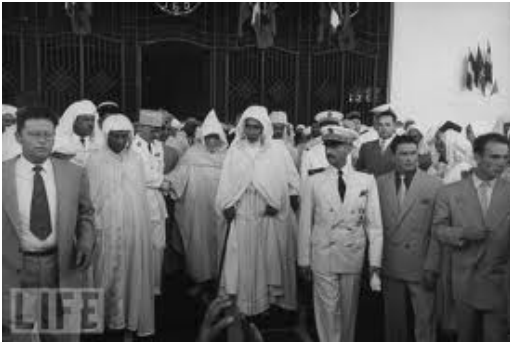
Mohamed Ben 'Arafa

ZK – Vous êtes Marocain comme l'a été Ben Arafa qui a été installé par la France à la place de Mohamed V. Vous êtes de cette engeance et vous y appartenez ! Le problème est que vous voulez être plus fidèle aux Français que les Français eux-mêmes.