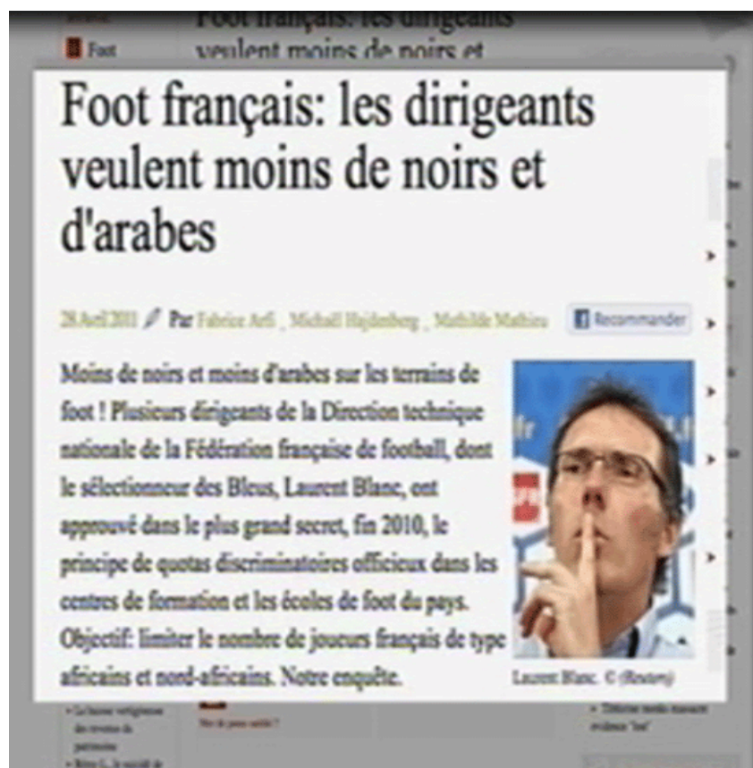
Gros titre de Mediapart

C'est avec ce gros titre et les détails dont est émaillé son contenu qu'a commencé ce qu'il a été convenu d'appeler l'affaire des quotas qui a secoué la société française tout au long d'une semaine. Le sujet de cette affaire fait l'objet d'une réunion de la FFF. Il se résume à limiter le nombre d'enfants Noirs ou Arabes qui ont la double nationalité et qui fréquentent les écoles françaises de formation au football. C'est une mesure qui est considérée comme discriminatoire dans la loi française. Et comme le cœur du sujet contrevient à la loi, aussi bien sur la forme que sur le fond, deux commissions