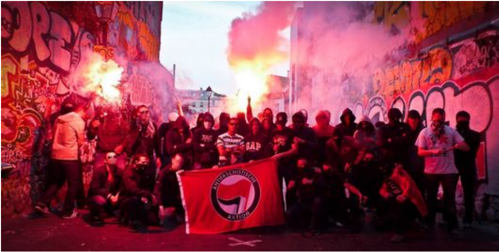
Un groupe antifasciste : une esthétique mi-racaille mi-activiste

Il est clair que la France ne s'appartient plus . Elle est gouvernée par une clique de pantins mondialistes locaux (actuellement le Parti socialiste) aux ordres des Soros et autres monstres de l'oligarchie transnationale, laquelle s'appuie à parité sur les institutions officielles et sur les milices de fait (racailles, gauchistes...) afin de réduire ce qui reste du peuple français à néant . Tout, absolument tout va dans le même sens : tout ce qui peut briser la convivialité populaire, instiller les germes de la terreur, favoriser les pires salauds et les plus profonds imbéciles... Le mondial-Système ne poursuit qu'une fin : détruire les deux valeurs fondamentales que sont le civisme et le patriotisme, c'est-à-dire la résistance des nations aux agressions internes et externes.