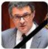
Erwann Binet @erwannbinet