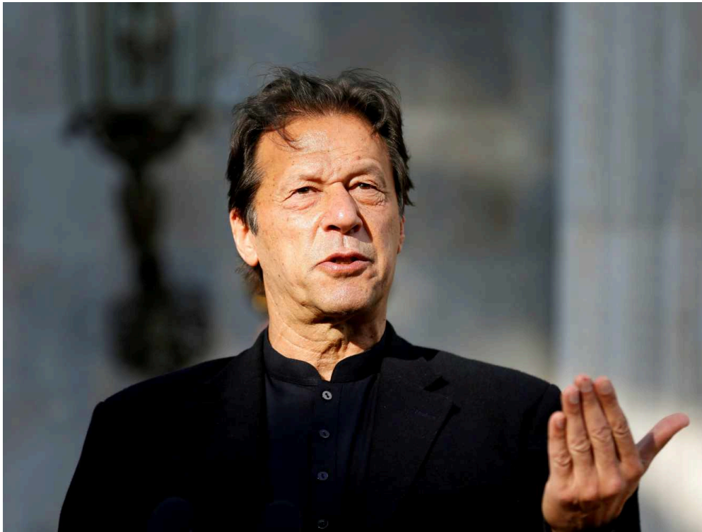
Le Premier ministre pakistanais

S'il y a une réaction qui devrait être faite d'une façon forte par la France de Macron, c'est bien cette réflexion antifrançaise du Premier ministre pakistanais Imran Khan qui trouve que caricaturer Mahomet est une insulte aussi grave que les crimes nazis.