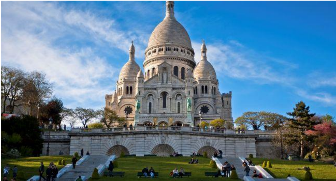
Le Sacré Coeur

Comme je le dis souvent, il n'y a pas plus dévastateur pour le pays que des révolutionnaires fous, ignares, qui comme nous l'avons connu lors de la Révolution Française, ont détruit les tombes royales de Saint Denis, et souillé les corps de nos Rois de France.