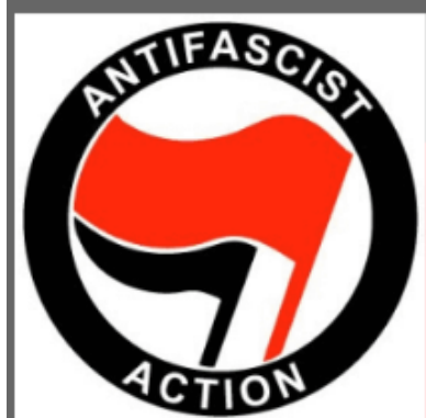
Colors and shapes