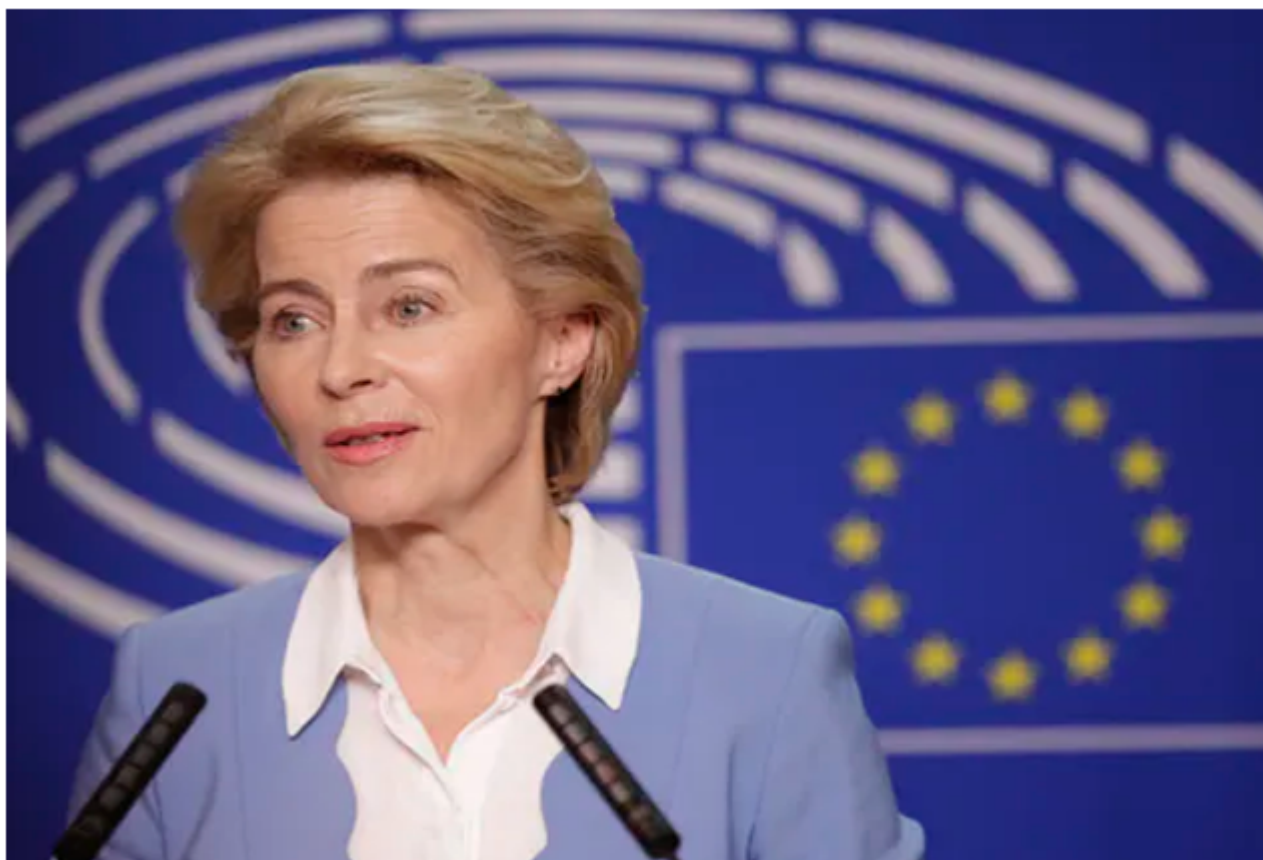
Ursula Von der Leyen, présidente de la Commission européenne

Enfin, je me demande si je ne préférerais pas l'alcool Junker... c'est dire !